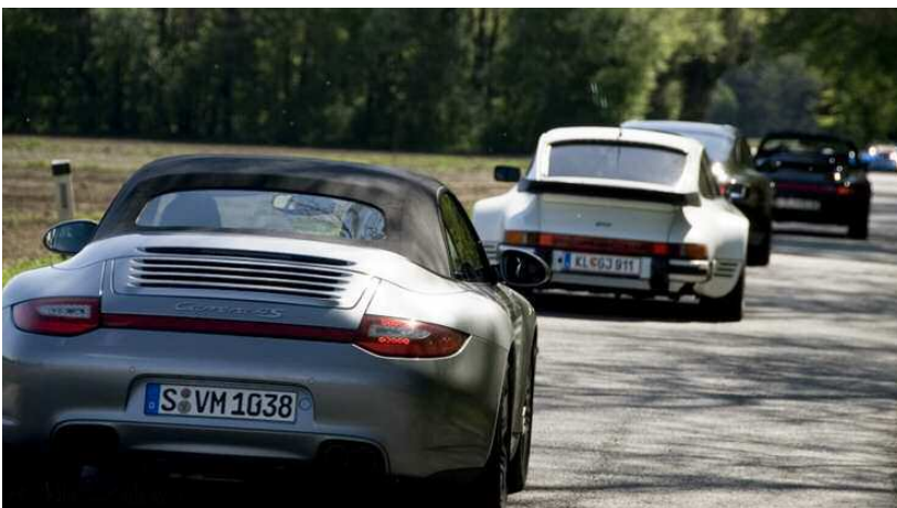
Probefahrt des neuen Porsche 911 (997 2. Generation) während der Cross Border Rallye