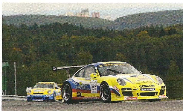
Welchen Einfluss wird der Siegeszug des FIA-GT3-Reglements mittelfristig auf den Porsche Alpenpokal ausüben? Miroslav Konopka (Foto) und Bernd Haid präsentierten die ersten 911 GT3 R